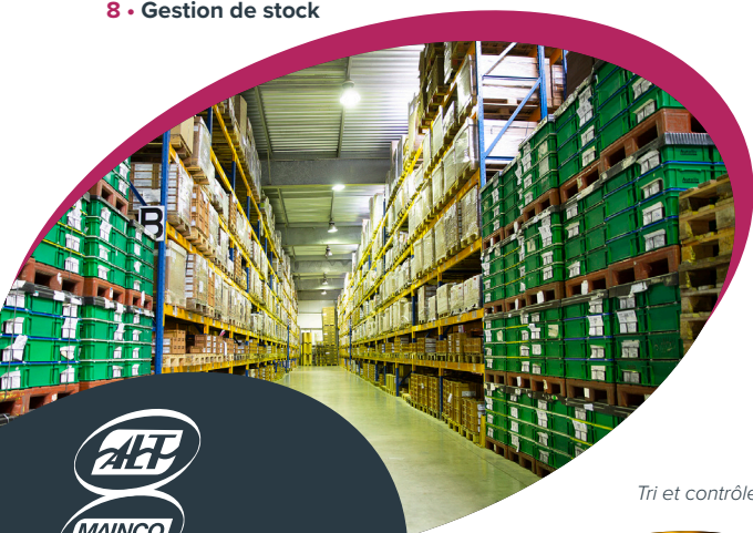
Tri et contrôle